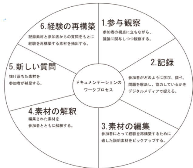
図2) ドキュメンテーション・ワークプロセス