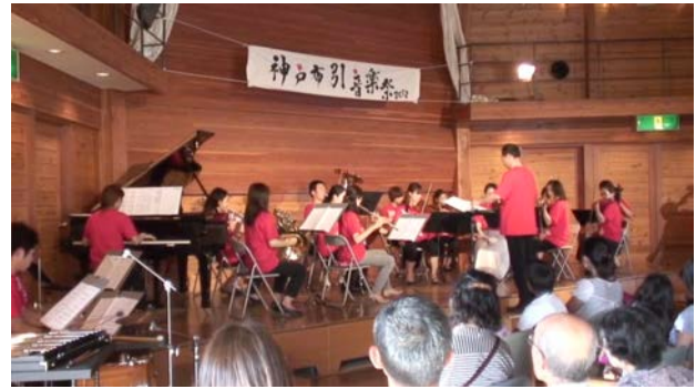
図4) 神戸布引音楽祭

デザイン・クリエイティブセンター神戸において行われた、子どもたちを対象としたワークショップ・プロジェクト。市内数カ所の施設のドキュメンテーションを行った。