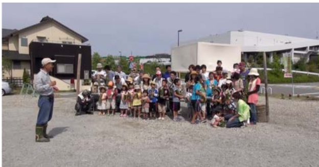
図3) 方丈の庵プロジェクト

平成24年度共同研究によって実施されたプロジェクト。ガーデンシティ舞多聞内（兵庫県神戸市垂水区舞多聞東3丁目）での学生活動をリアルタイム・ドキュメンテーションした（図3）。