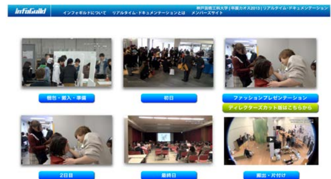
図5) 神戸芸術工科大学卒展「カオス」

神戸芸術工科大学卒展「カオス」の準備から片付けまでをリアルタイム・ドキュメンテーションした。参加学生は延べ約30名（図5）。データはwebサイトにて公開されたほか、FacebookやTwitterなどを用いて、広く公開された（図5）。