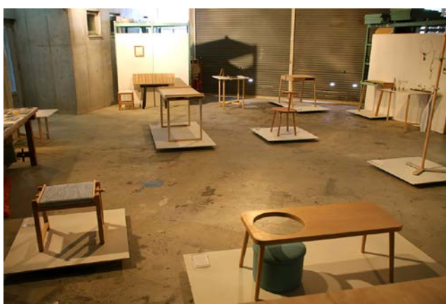
写真6) 学生メンバーが作り上げた、学内での展示会風景。

ミラノでの展示は、本研究メンバーが主体となって展示構成等を行っていた。このプロセスを見て、実際にその空間での展示会を体験した上で、学生たちが考えて展示を作り上げた。作品のレイアウト、視線のコントロール、照明のバランス、ポスターや配布資料の作成、会期中の会場運営に至るまで、学生たちがデザインし、実践し、質の高い展示会を作り上げた。