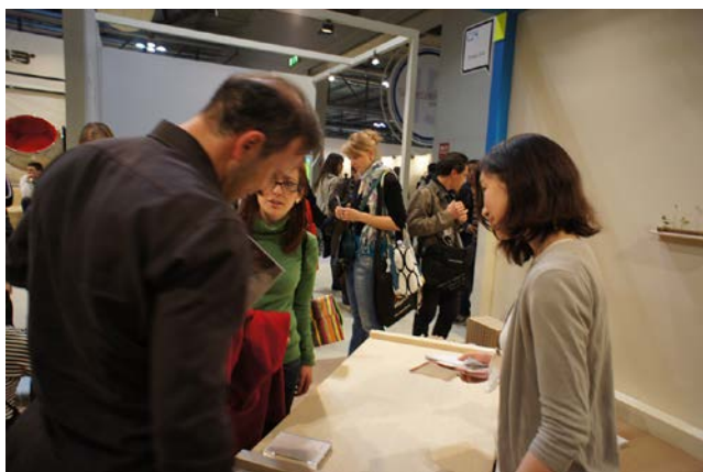
写真5) Salone Satellite 展示ブースで、来場者に英語で解説をする学生。

2012年7月、ミラノ・サローネに出展した作品を学内で展示する機会を設けた。これは、学内での成果報告の一環であるが、もうひとつの重要な目的として、ミラノでの展示会を経験した上で、学生たちに「自分たちだけで展示会を作り上げてもらう」という課題を課す事があった。