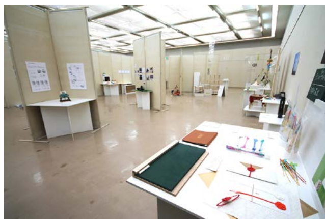
写真7) 卒展2013のプロダクトデザイン学科ブース展示風景。

ン学科の展示デザイン、展示会運営に中心的に関わった。卒展の展示空間のデザイン、会期中の運営だけに留まらず、展示台製作等の準備や、搬入・搬出に至るまで、非常に質の高い卒展になったのは、DESIGN SOILのメンバーとして質の高い展示会を経験し、その経験を通して考え、展示会を作る実践を行っていた事が大きく影響していると考えられる。