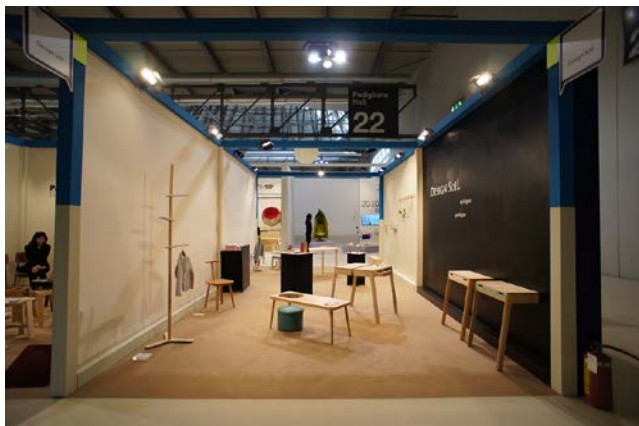
写真2) 2012年4月の Salone Satellite 展示風景。

昨年度に引き続き、世界各国の様々なメディアの注目を集め、多数の媒体に情報が掲載された。中でも、非常に感度の高い韓国のデザイン誌 "MARU" 127号では、6ページにわたって全作品を詳細に紹介される等、世界に認められるコレクションとなった。