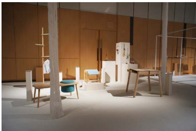
写真3) 2012年10月の TIDE EXHIBITION 展示風景。

2012年9月には、昨年度の Salone Satellite で発表した学生作品が、フランスの権威あるデザイン誌、ELLE DECORATION の25周年を記念した展示会の出展作品として選ばれ、約半年にわたってフランス国内を巡回した。この展示会のキュレーターは、2011年の TIDE EXHIBITION でこの作品を見て出展作品に選んだとのことで、展示会出展がきっかけで生まれた成果であり、