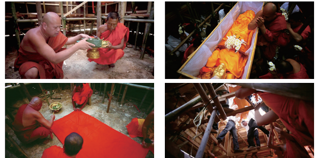
写真4 左：メル塔建造許し儀式 右：死亡粧を終えた遺体はハッサディーリンの内部に安置し、火葬に備える