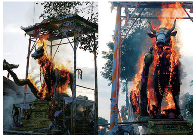
写真3 炎で遺体を焼き尽くす雄牛形の柩