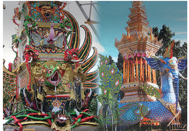
写真2 靈獣の意匠が集合するパデとメル塔（葬儀山車）