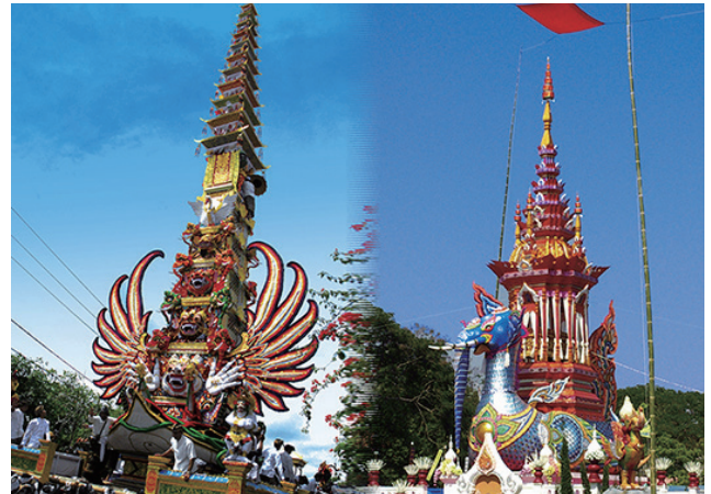
写真1 左：パデ葬儀塔 右：ハッサディーリンのメル塔

この舞踊は、畏敬の対象でもある魔物や、悪魔の所作を起源としている。大きく丸く見開いた目を持つ仮面には、白を基調とし、前歯だけを見せるマニスと、口を開き、上下の歯と舌