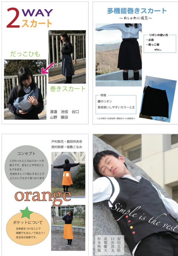
図1 減災・服飾講座の制作物

「減災」とは、避けることのできない災害に対して、被害をできるだけ少なくするための備えという考え方である。このテーマでは、日常生活で使用しているモノが、い