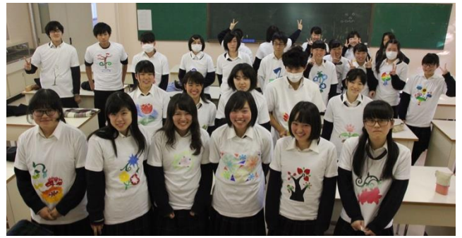
図4 色彩・アート講座の文様作品