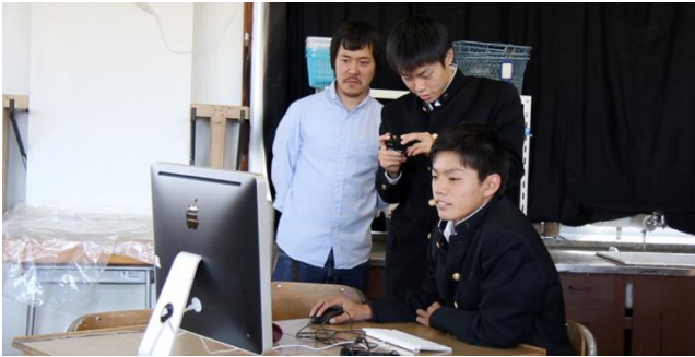
図3 情報技術・リテラシー講座における各講座のドキュメンタリー制作