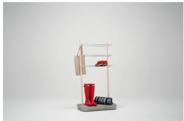
写真6 商品化検討作品 「PERCH」