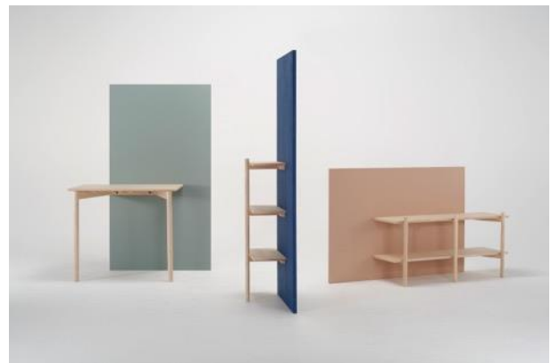
写真5 商品化検討作品 「A WALL」

ミラノで展示をした作品の中から、「壁」を容易に移動させられる家具としてデザインした「A WALL」(写真5)と、靴を電線にとまる鳥に見立てて収納する「PERCH」(写真6)が、株式会社伊千呂で商品化することとなり、現在開発を進めている。また、布の袋に砂を入れ自由な形で積んで遊ぶことができるオブジェ「KUMONE」(写真7)が、大阪のインテリアショップのオリジナル商品として商品化を打診され、こちらも開発を進めている。