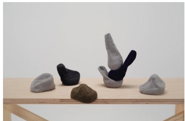
写真7 商品化検討作品 「KUMONE」