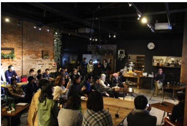
写真4 「SAFARI」 展トークイベント

2016年度ミラノで出展する作品の制作にあたり、テーマ設定から株式会社伊千呂との共同プロジェクトとして活動した。デザインの途中段階から、家具メーカーの方のアドバイスが入ることで、これまでよりも製品然とした作