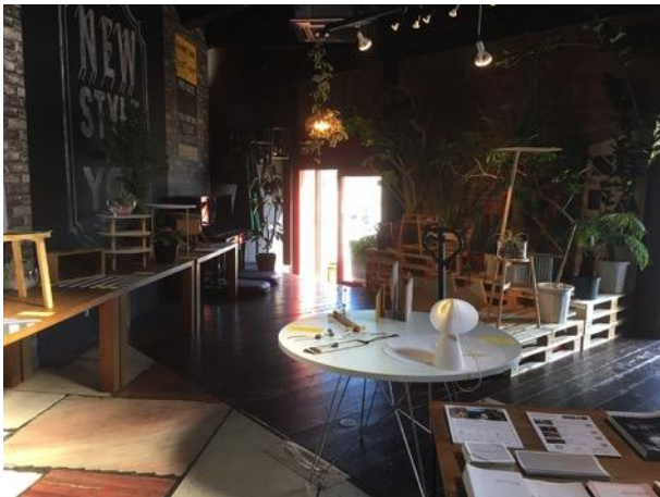
写真3 「SAFARI」 展会場

ミラノで展示した新作と合わせて過去の作品も展示し、展示会に合わせて、DESIGN SOILのメンバーや卒業した元メンバーが話し手として自身の体験について語るトークイベントを開催し、多くの来場者が訪れた(写真4)。参加した学生からは、「身近にいる先輩や同級生の言葉で、世界のデザインの状況や空気感を聞くことができた」、「先生やデザイナーさんから授業で聞くだけだと、遠い世界のことのように感じてしまうが、同じ学生、しかも身近な人から聞くと、とても身近にあることのように感じて、意識を変えるきっかけになったと思う」といった意見が聞かれ、学生が直接現地の空気に触れ、自身の言葉で周りの学生に伝えることが最もリアリティのあることとして強く響くということが確認できた。