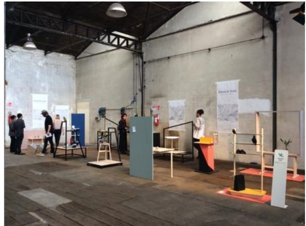
写真2 VENTURA ACADEMIES での展示風景

5月に神戸芸術工科大学キャンパス内のウッドデッキ広場で報告会を開催し、新メンバーの募集を行った。