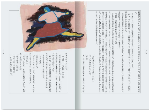
図3『木の葉のように』