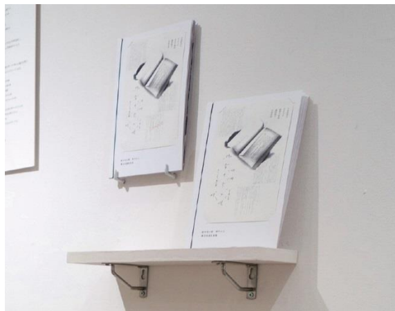
図8 書店回遊記録集(判型：幅128×高さ188mm)