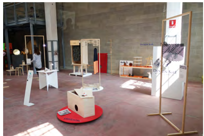
写真2 VENTURA ACADEMIES での展示風景