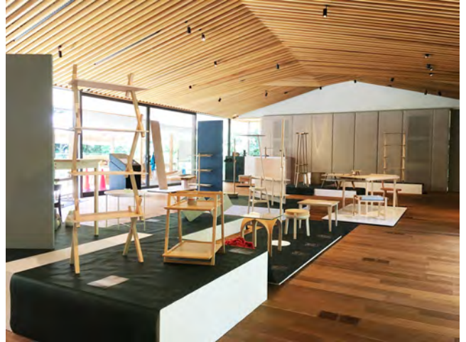
写真5 竹中大工道具館での展示会

6月には新神戸にある竹中大工道具館で、VENTURA ACADEMIES 出展作品と、これまでのDESIGN SOILの作品から選んだ作品、合わせて46点を展示する「神戸芸術工科大学デザインソイル展」を開催した(写真5)。