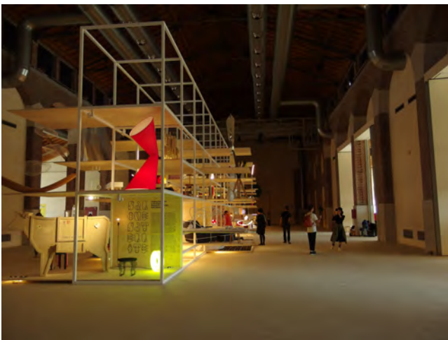
写真4 「SaloneSatellite 20 years of new creativity」会場

5月に学内のプロダクト・インテリアデザイン学科工房で報告会を開催し、新メンバーの募集を行った。