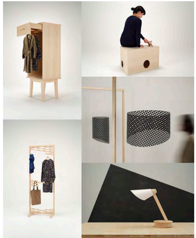
写真1 VENTURA ACADEMIES への出展作品

されることではない「欠ける」「無くなる」という状態に着目した。例えば折れた棒にも別の使い道があるように、失うことが新しい価値につながる場面がある。穴が開いたり、底が外れたり、何かを失って初めて気がつく発見からインスピレーションを受け、ものの一部が無くなることで生まれる機能を探し出し、家具の新しい可能性として提示した作品5点を展示した(写真1)。今年度も、VENTURA LAMBRATE の各種展示の中で、世界各国の大学が展示を行う「VENTURA ACADEMIES」という枠での出展となった(写真2)。