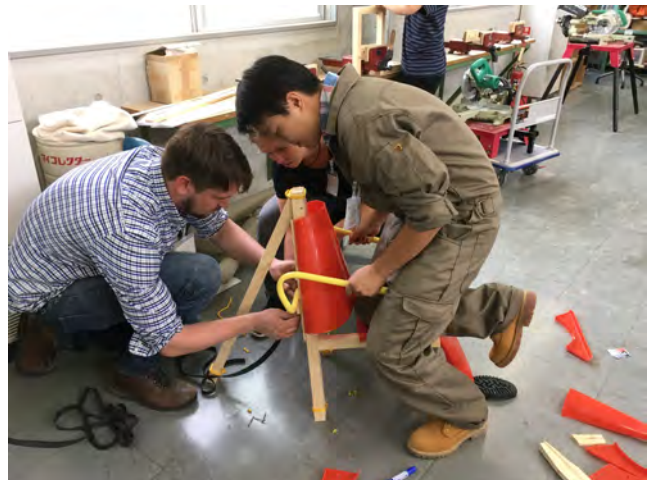
写真6 本学におけるヨーテボリ大学ステネビー校とのワークショップの様子

会期中には、スウェーデンの洗練された木工技術をベースに、クリエイティブなプロジェクトに取り組むスウェーデンのヨーテボリ大学ステネビー校木工家具デザインコースの教員と学生が来日し、竹中大工道具館の展示に訪れ、本学学生ともワークショップなどを通して交流した(写真6)。DESIGN SOILの活動、クリエイティビティや作品の質が評価され、コラボレーションの打診を受けた。