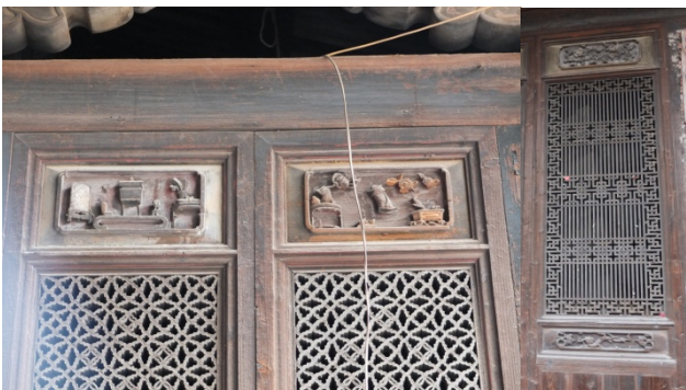
写真 8) 中憲第中庁の建具彫刻上部 (左)。組子の銭紋が豊かさ (=財) を象徴し、上部飾り板の博古図は知識や品格を表す。／写真 9) 中憲第中庁の建具 (右)。組子は周囲に卍字を巡らし、柿の図柄と合わせて「万事如意」や「萬世萬代」を表す。

下梅村と泉州・南安とでは、門樓の有無という建築構成上の大きな差異が存在し、このことにより民居の外観には大きな相違が感じられるが、吉祥彫刻の配置の面から考えると、下梅村の門樓が泉州・南安の下庁（門庁）に相当する役割を果たしていると考えられ、いずれも入口に吉祥彫刻による装飾を高密度に集中させる点が共通している。そしてさらに、彫刻の寓意内容においても、一般的な吉祥祈願や品格の表現、さらには個人的な願望に至るまで、同様のモチーフが取り入れられていることが見えてきた。この事実は、山西省の事例とは根本的に異なり、両地域が建築形式の相違を超えて、一定の精神文化を共有していることを意味している*4)。より確かな論証のためには、時間をかけ閩北の門樓や閩南の下庁（門庁）の壁面構成を詳細に記録し、もっと精緻な比較を行う必要があるが、ひとまず上記の仮説を得たことを、本研究調査の成果と位置付けたい。