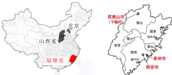
図1) 福建省の位置(左) / 図2) 福建地方の民居分布と今回の調査地(右)。福建地方は図の6区域で民居形式が異なる*3)。

具体的な調査地には、福建地方の民居の多様性を簡便に把握する意図のもと、閩北の武夷山市に所在する下梅古民居群と、閩南の泉州市及び南安市に所在する古民居をとりあげた。下梅は晋商が築いた長大な茶葉の交易ルートの起点として著名で、清代を通じて茶葉取引を牛耳った鄒氏の邸宅（鄒氏大夫第）等が残る。また泉州は南宋以降、国際貿易都市として繁栄し、奥行方向だけでなく庁堂の両脇に房屋を発達させた特徴的な民居形式がみられる。