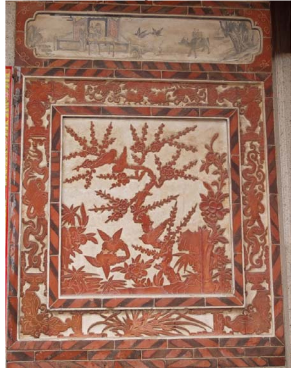
図 4) 蔡資深民居東側中央部の合院 (1867 年建立) 平面図 (左上) / 写真 10) 同・下庁入口 (右上) / 写真 11) 同・下庁入口東側の壁面レリーフ (右上)。中央は梅、喜鵲、蘭、寿石、靈芝、竹により飾られ、喜上眉梢や四君子などを表す。その周囲は四隅に長寿を表す蝶、上部に多子多産を表す葡萄と鼠、下部に品格を示す蘭、左右に四芸集雅を表す棋盤と琴が配置されている。四君子と四芸集雅は、入口西側のもう一枚のレリーフと対をなしている。