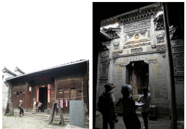
写真1) 鄒氏大夫第門庁(左) / 写真2) 同・門庁から見た門楼(右)

以上の特徴を示す一例として、以下では參軍第を紹介する。參軍第は清代乾隆年間(1736-95)に方氏が建立した邸宅で、下梅村北街に所在する。門庁は無く、正面入口から順