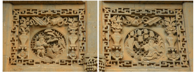
写真 6)同・上部左側レリーフ /写真 7)同・上部右側レリーフ ており、中心の主題は、左側が進財獲利を意味する「漁翁得利」、右側が芭蕉を摘む農夫と福を表す佛手柑とで「招福」、主題横の花瓶は「四季平安」、また主題の上下には品格を表す「四芸集雅」や「菊花」、外周に魔除けの「龍」が配置されている。したがって、門楼一極に集められた吉祥彫刻には、社会平和への願いから一般的な吉祥祈願や品格の表現、さらには個人的な願望に至るまで、多様内容が含まれることがわかる。このようなモチーフの題材や配置構成は、下梅村の他事例においても非常に類似していた。