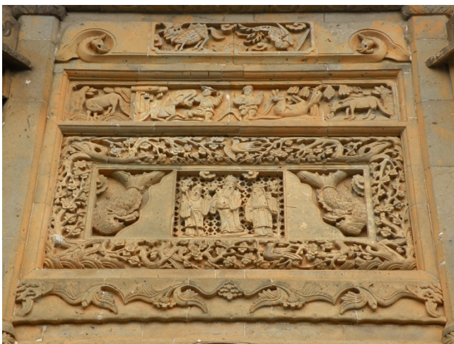
写真 5)参軍第・門楼上部中央レリーフ

上部中央の装飾は、最上部が天下泰平を意味する「麟鳳呈祥」、2段目にはすぐに成功を手にするを意味する「馬到成功」、3段目の中央には吉祥全般を表す「福禄寿三星」、その両脇には竜生九子の一つで火災を防ぐ「螭吻」、それらを囲む梅と鳥（喜鵲）は喜びを表す「喜上眉梢」となっている。これらの左右には対になった彫刻が配置され